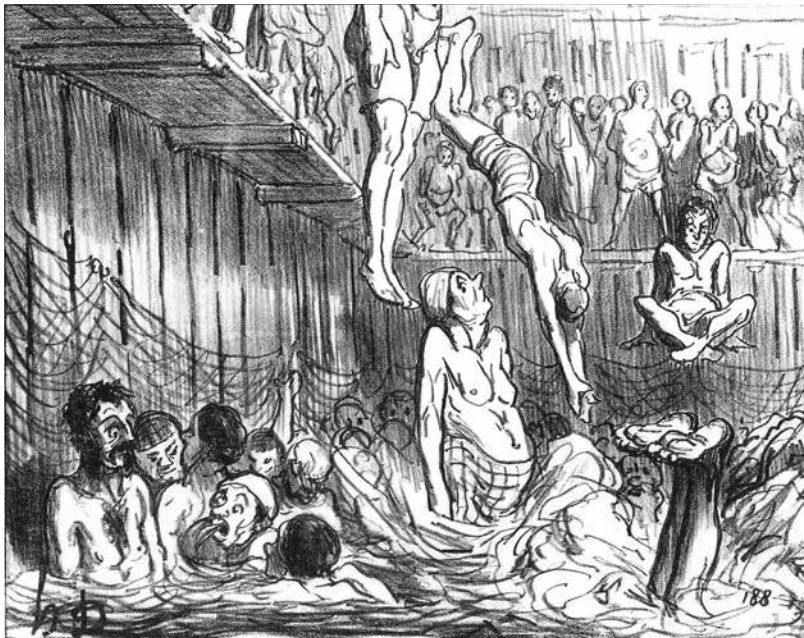
Honoré Daumier (1808 - 1879), Les baigneurs à quatre sous de la série Croquis d'été, pl. 29, pour Le Charivari, du 28 juin 1858

A l'approche de la célébration des performances olympiques, le musée présente un ensemble de près de 90 lithographies satiriques d'Honoré Daumier (1808-1879) sur le thème des baigneurs. Observateur affranchi, le dessinateur traque les turpitudes des parisiens et parisiennes se jetant à l'eau, qu'ils barbotent dans les premières piscines, trempent dans la rivière, ou qu'ils affrontent bravement les vagues. Dans un contexte où l'on commence tout juste à envisager l'intérêt d'une activité sportive, perçue comme éducative et hygiénique, l'artiste prend ce prétexte pour mettre à nu ses contemporains ordinaires, les déshabiller littéralement. Les postures et comportements de ces baigneurs et baigneuses en petite tenue dévoilent tour à tour leur ingénuité, leur maladresse ou leur hardiesse, leur conformisme, leur bêtise, et parfois même leur goujaterie.