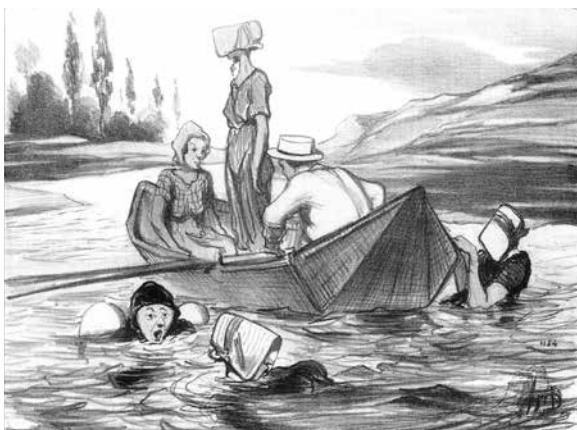
Honoré Daumier (1808 - 1879), En pleine eau de la série Les baigneuses, pl. 12, pour Le Charivari, du 29 août 1847