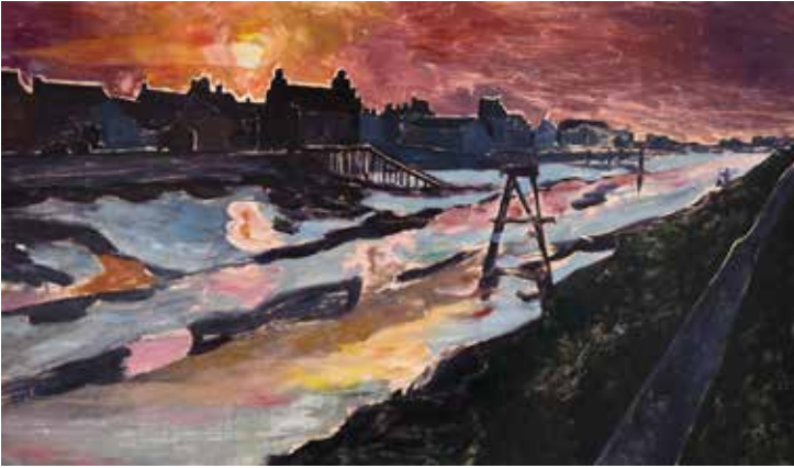
Assunta Genovesio (1972), Chenal à marée basse , 2022, monotype en couleurs Coll. Musée de Gravelines