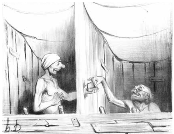
Honoré Daumier (1808 - 1879), Dites donc, père Coquardeau, il est joliment frais - Pardine ! j crois bien de la série Les baigneurs , pl. 15, pour Le Charivari , du 9 août 1840 Coll. Musée de Gravelines