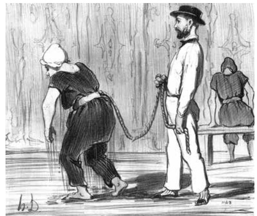
Honoré Daumier (1808 - 1879), Madame Rabourdeau à sa première leçon de la série Les baigneuses, pl. 5, pour Le Charivari, du 5 août 1847