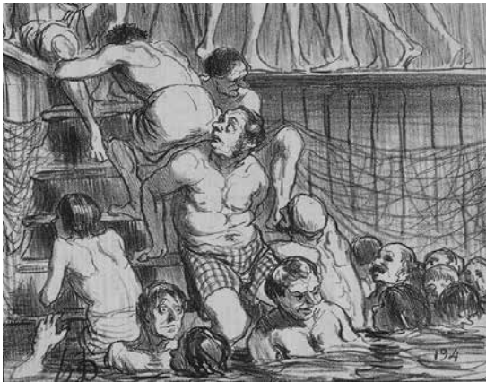
Honoré Daumier (1808 - 1879), Aux bains Deligny - L'échelle à quatre heures de la série Croquis d'été , pl. 33, pour Le Charivari , du 9 juillet 1858 Coll. Musée de Gravelines