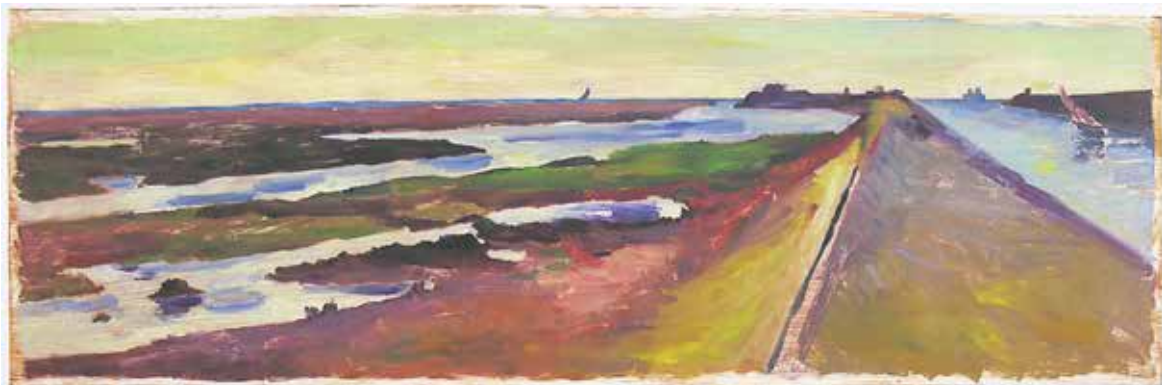
Assunta Genovesio (1972), La jetée, marée montante , 2019, monotype en couleurs - Coll. Musée de Gravelines