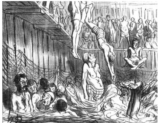
Honoré Daumier (1808 - 1879), Les bains à quatre sous de la série Croquis d'été, pl. 29, pour Le Charivari, du 28 juin 1858